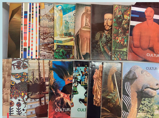
Capas da Revista Cultura

No trabalho de organização dos periódicos, a equipe se surpreendeu com a beleza das capas da Revista Cultura. Com o conjunto da obra reunida, é possível ver e admirar uma exposição de obras de arte.